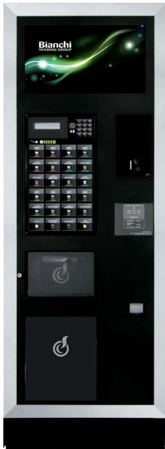
LEI500 L B.SMART

LEI500 L NEUES VENDING DESIGN, WELCHES IM BAUKASTENSYSTEM KONZIPIERT, FLEXIBEL UND KOMMUNIKATIONSSTARK IST.